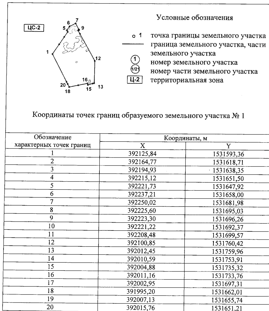
Схема границ образуемого земельного участка, расположенного по адресам: г. Екатеринбург, ул. Агриппины Полежаевой, 43, ул. Агриппины Полежаевой, 43а, ул. Агриппины Полежаевой, 43б

Схема границ образуемого земельного участка, расположенного по адресу: г. Екатеринбург, ул. Колмогорова, 52